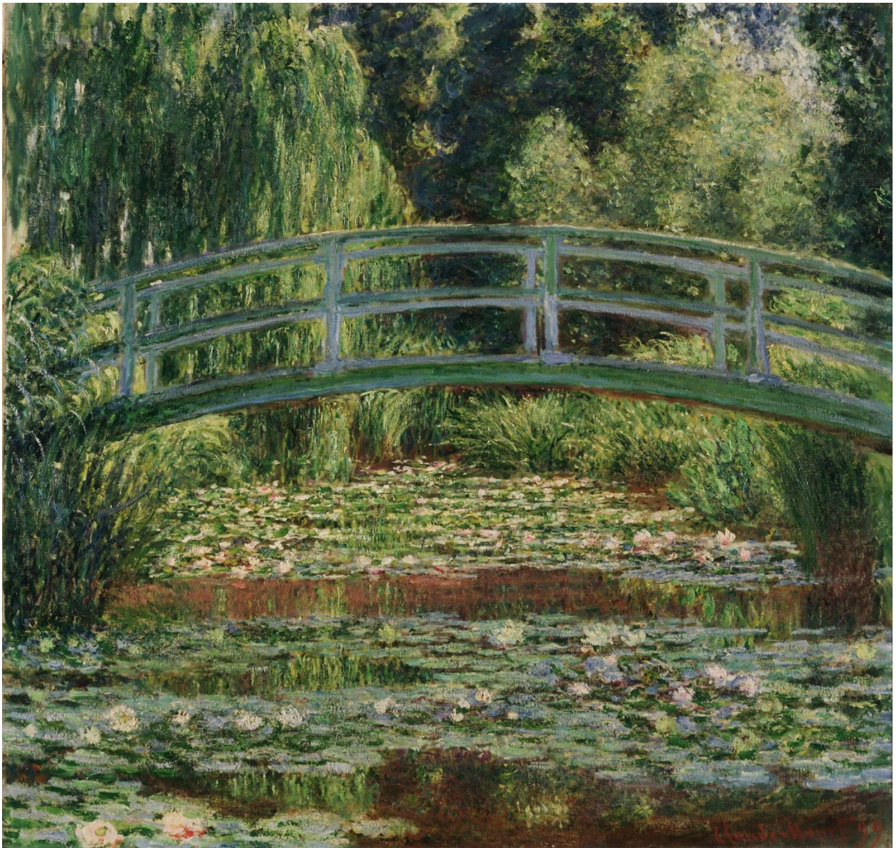
O Lago com nenúfares, harmonia verde (Le Bassin aux nymphéas, harmonie verte)